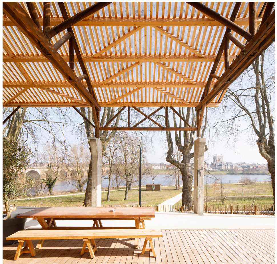
Espace sous la halle

Les enjeux du projet ont donc été, du point de vue constructif, d'inscrire le projet dans une économie de ressources et une intelligence de mise en œuvre, en