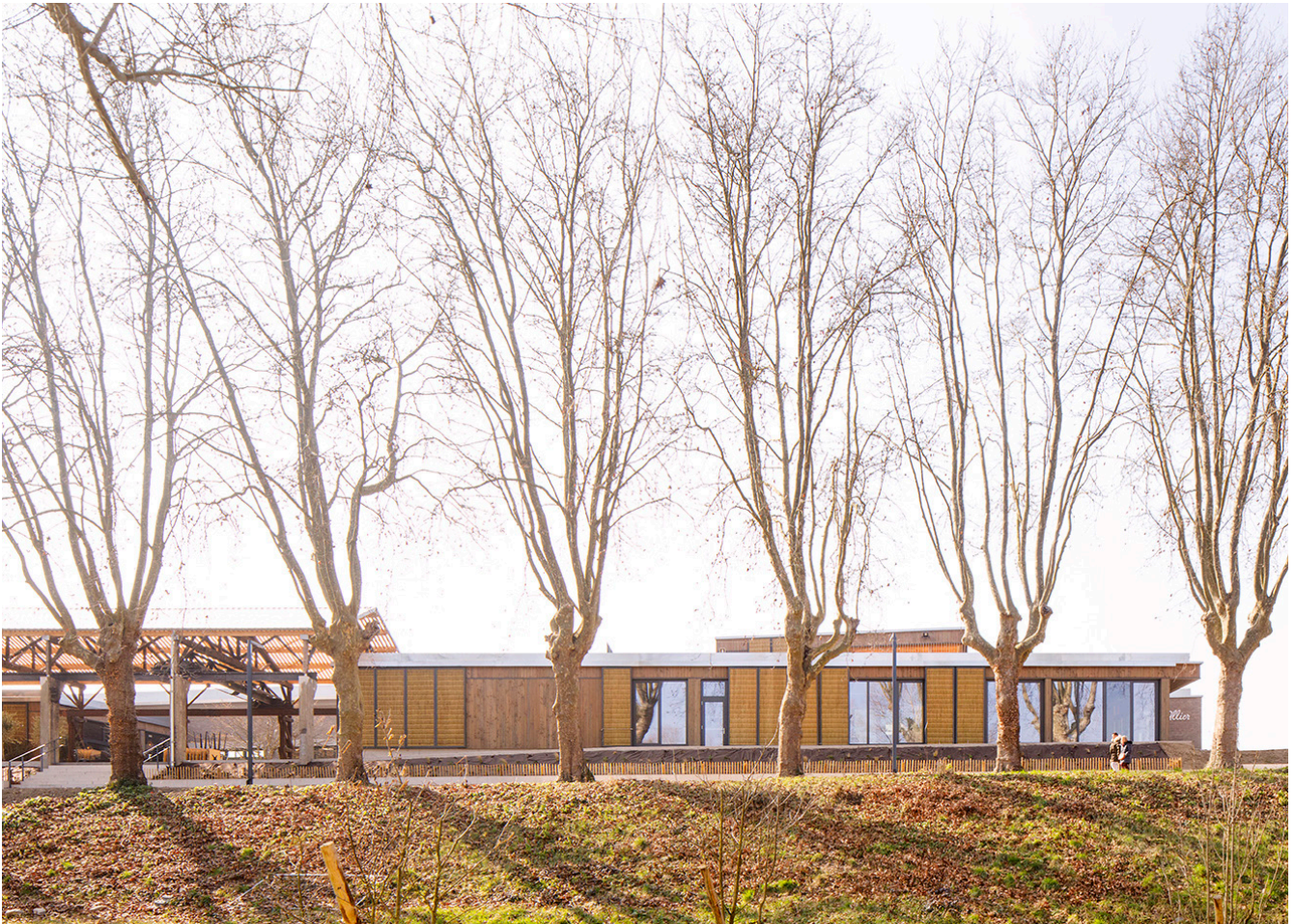
Vue de la Maison de la rivière Allier depuis les berges