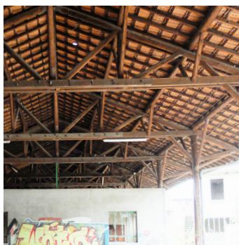
Entrepôt est - Halle en bois