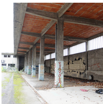
Entrepôt ouest-ossature béton

Cette relation duale donne du sens au projet, et crée des espaces riches et diversifiés, permettant d'associer entre eux avec finesse les différents éléments de programme, qui sont les suivants : un lieu d'interprétation du patrimoine, les bureaux du service patrimoine de la collectivité, un lieu de sensibilisation à l'environnement, un lieu de location de vélo, un restaurant, des vestiaires publics pour faciliter les pratiques récréatives en bord de rivière, une base nautique pour les canoës et kayaks.