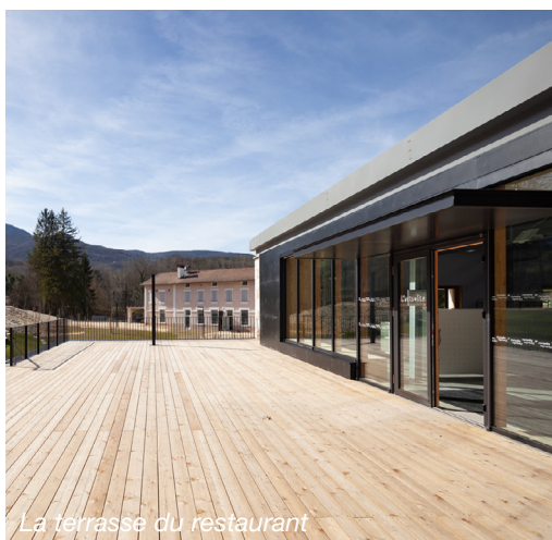
La terrasse du restaurant