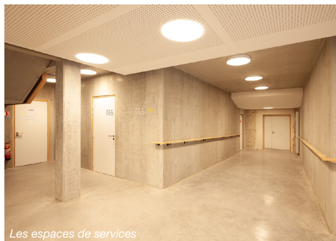
Les espaces de services