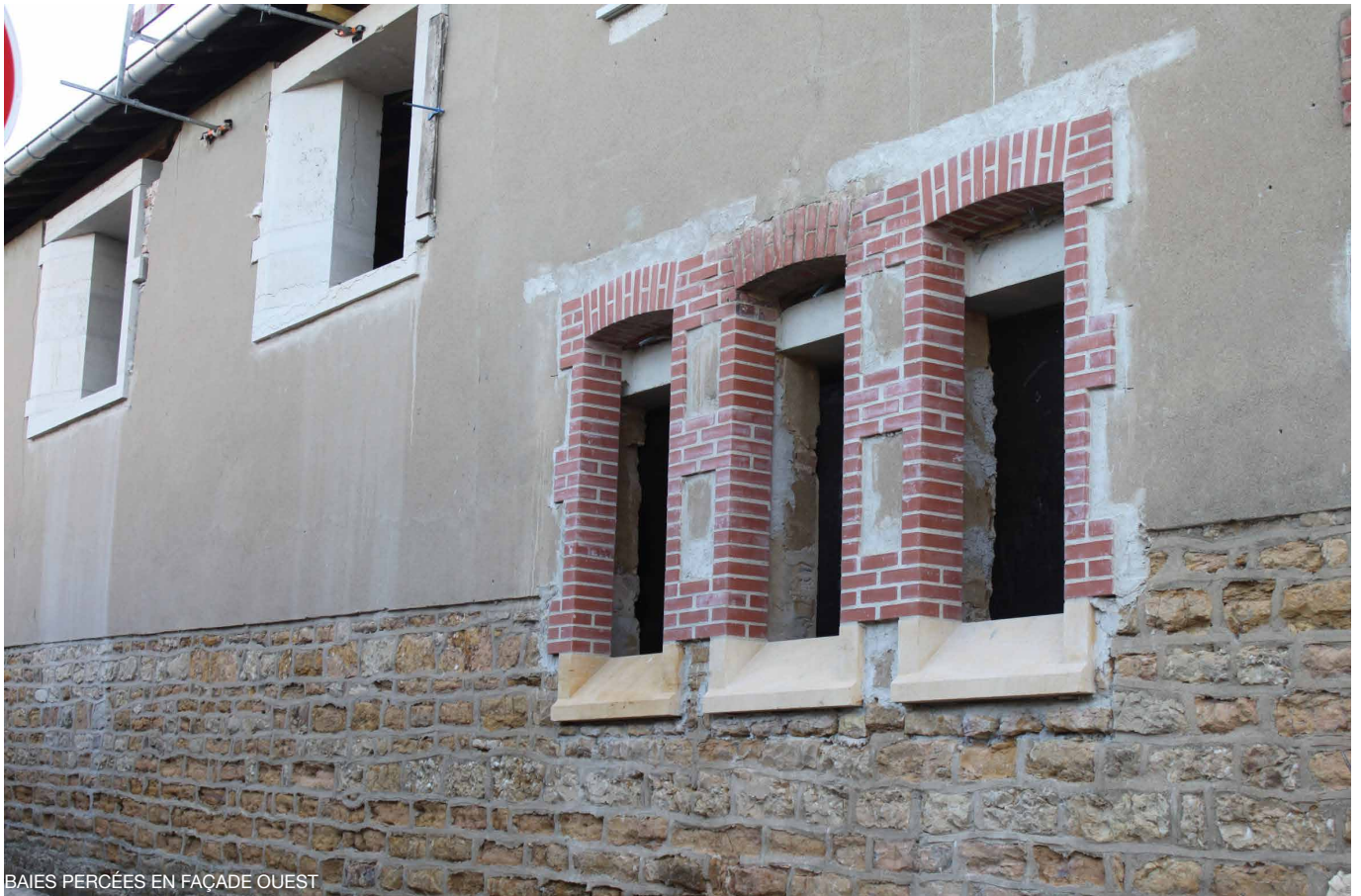
BAIES PERCÉES EN FAÇADE OUEST