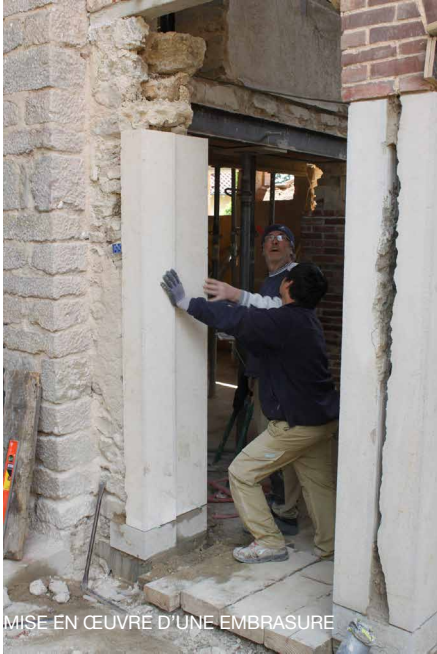
MISE EN ŒUVRE D'UNE EMBRASURE